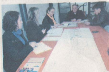
REPRESENTANTES das secretarias municipais de Obras e de Gestão foram à Câmara ontem para dar explicações sobre o andamento do projeto

- Os pontos de táxi existentes nas esquinas serão recuados para o meio das quadras.