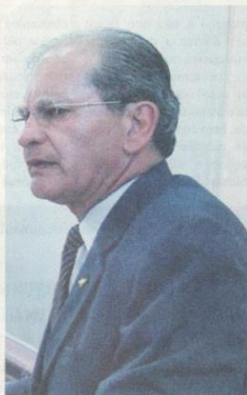
PREFEITO municipal Luiz Américo Aldana

Vamos aguardar o posicionamento da mesa diretora para definir o caminho a seguir