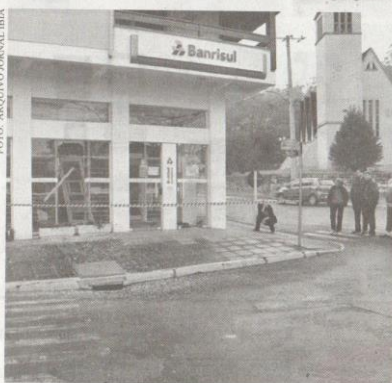
OS ALTOS índices de assaltos aos bancos no interior motivaram projeto

Em caso de veto, ele será analisado pelos vereadores, que podem mantê-lo ou derrubá-lo por maioria absoluta de votos (seis de dez).