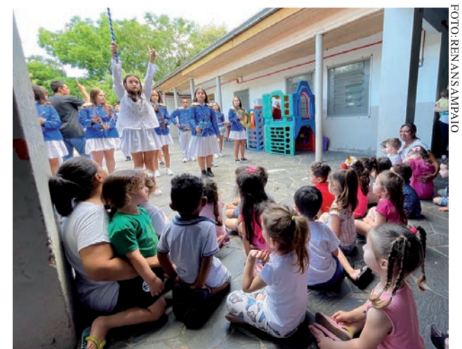
Banda da escola José Pedro Steigleder animou a tarde

Ferraz, que fica localizada junto à sede administrativa, na rua Dr. Bruno de Andrade, promoveu um encontro festivo com suas turmas. A creche também recebeu a visita de um ex-aluno que tocou violão na hora dos “parabéns” e da banda da escola municipal José Pedro Steigleder, que fez uma apresentação e animou a tarde dos pequenos. (CA)